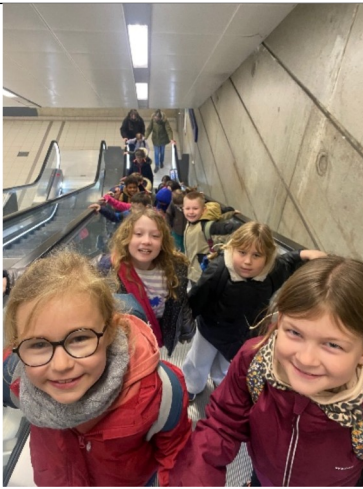
Escalator Métro Rennes Jeudi 26 mars

Nous avons pris l'escalator pour sortir du métro puis nous sommes partis sur les traces des mosaïstes Italiens.