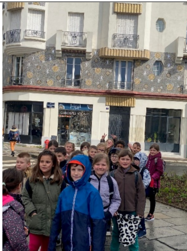
Immeuble Poirier Mosaïque Odorico Mosaïste Italien

Nous avons pris l'escalator pour sortir du métro puis nous sommes partis sur les traces des mosaïstes Italiens.