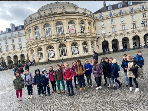
L'opéra Façade arrondie

Nous sommes devant la maison d'Odorico qui est maintenant une crêperie.