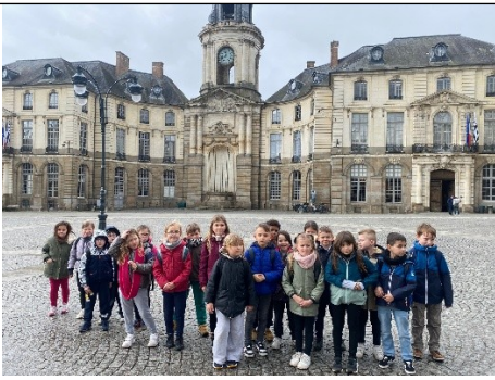
L'hôtel de ville La niche Les drapeaux L'horloge

Nous sommes allés à l'Hôtel de ville que l'on reconnaît parce qu'il y a la niche qui accueillait les statues des rois.