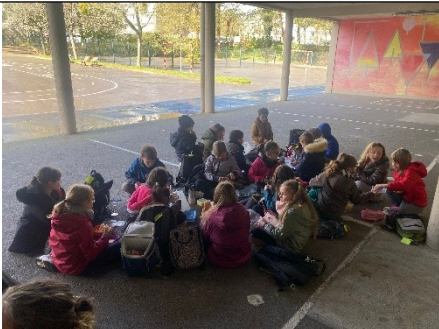
Pique-nique Une ancienne école sous le préau Kennedy

Jeudi 26 mars, nous sommes allés à Rennes. Nous avons pris le métro pour aller dans le centre-ville.