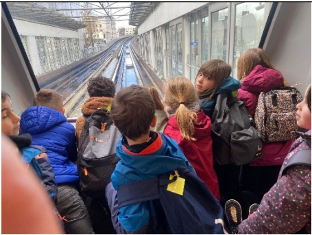
Métro Centre historique de rennes Visiter Rennes Mosaïque

Nous sommes allés à l'Hôtel de ville que l'on reconnaît parce qu'il y a la niche qui accueillait les statues des rois.