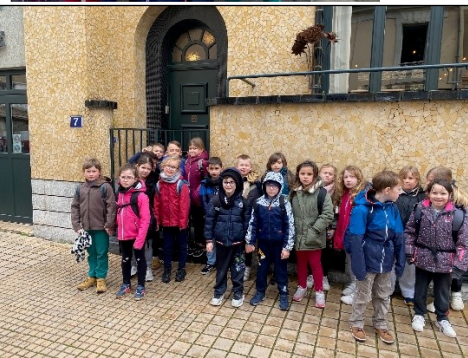
Maison d'Odorico Crêperie Mosaïque

Nous avons trouvé de la mosaïque sur l'immeuble Poirier.